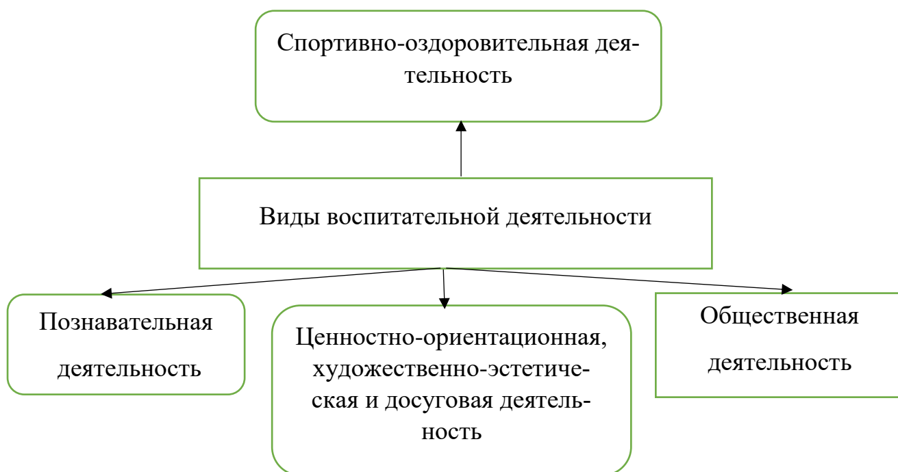
Схема 2. Виды воспитательной деятельности в АНО ВО «НОИ СПб»

процессе воспитания: познавательная, общественная, ценностно-ориентационная, художественно-эстетическая и досуговая деятельность, спортивно-оздоровительная деятельность.