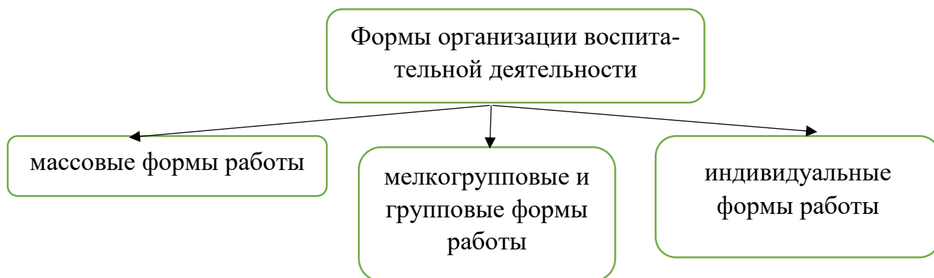
Схема 3. Основные формы организации воспитательной работы, применяемые в АНО ВО «НОИ СПб»

Воспитание в большей степени строится на взаимодействии обучающегося сего окружением поэтому, сочетание разных форм индивидуальной, групповой и массовой работы в воспитательных мероприятиях считается наиболее важной, значимой, чем в обучении.