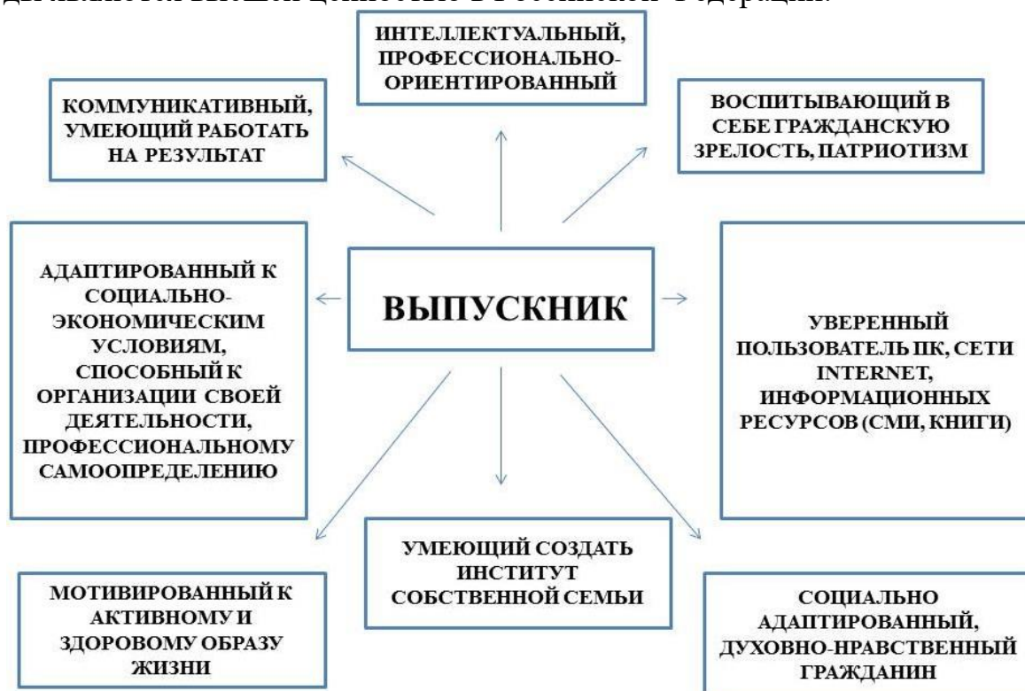
Рис. 1 – Вариативная модель целеполагания воспитательной работы в Институте, ориентированная на выпускника

Использование в воспитательном процессе идеи того, что человек его права и свободы являются высшей ценностью в Российской Федерации.