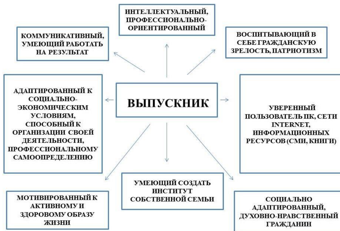
Рис. 1 – Вариативная модель целеполагания воспитательной работы в Институте, ориентированная на выпускника

Использование в воспитательном процессе идеи того, что человек его права и свободы являются высшей ценностью в Российской Федерации.